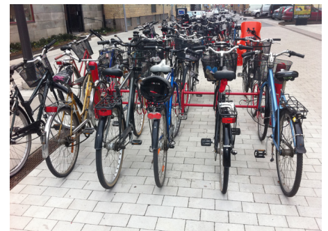
Rätt ställ på rätt plats ger ordning.

Varje dag görs mer än en miljon cykelresor i Sverige.