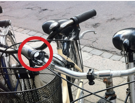
Otillräcklig fackdelning leder till repor och skador på växlar och bromsvajer.

Användandet av äldre cyklar väcker tankar. Statistik visar nämligen att 5-9 % av alla personskadeolyckor med cykel beror på fel på cykeln, dess bromsar och kedja mm. Om bättre cykelparkeringar kan minska skador som beror på mekaniska fel på cykeln med 5- 10 % skulle det innebära minst 20 – 60 färre personskador per år i riket.